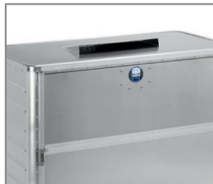
La cerradura digital cumple con los requisitos de la seguridad clase 3