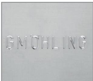
Relieve y/o numeración consecutiva