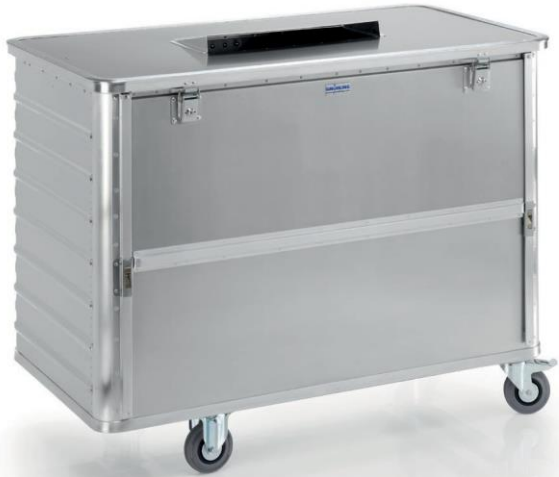
Contenedor de eliminación de datos G-DOCU® D 3709/650 E2HS