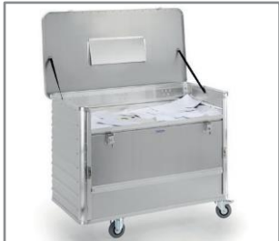
Ejemplo de aplicación