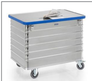
Parachoques de PVC en la tapa