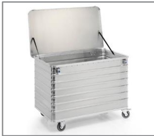
Ejemplo de aplicación