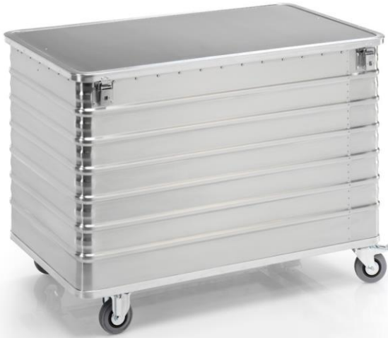
Contenedor de eliminación de datos G-DOCU® D 3009/656