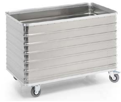
G®-TRANS D 3008