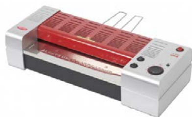
intimus PE-332 Educator