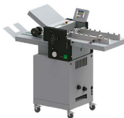
Multigraf 235 (A3-A2)