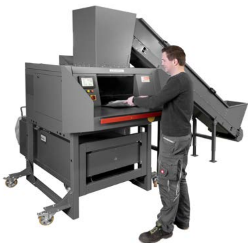
intimus 16.99 SmartShred (Prensa de Balas)