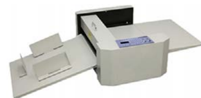
Magnum MC-35 M