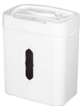
intimus 20 CP4