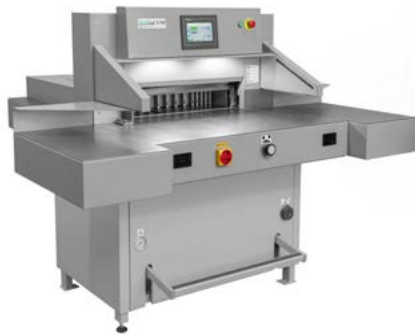
intimus 7310 EPSH Powercut

Dimensiones 1105 x 1755 x 1460 mm Peso 580 Kg