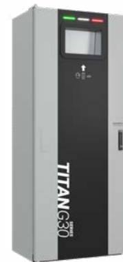
G30 Sistema de retorno