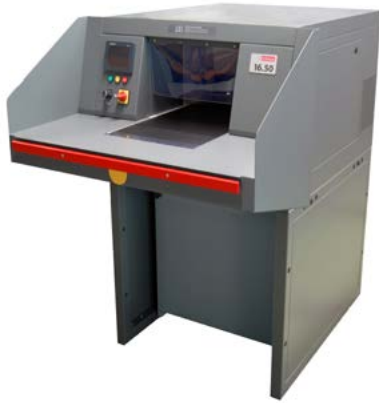
intimus 16.50 SmartShred