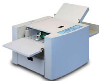
AEROFOLD Plus (A3+)