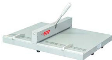
intimus CR-460 MC