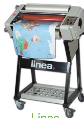
Linea DH-360 & 460

Dimensiones DH-360 640 x 420 x 310 mm. Peso: 30Kg. Dimensiones DH-460 750 x 420 x 310 mm. Peso: 45 Kg.