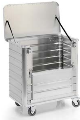
G®-TRANS D 3508