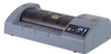
intimus PHS-330 & 450 High Speed