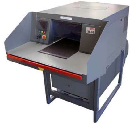
intimus 16.86 SmartShred ( Prensa de Balas )