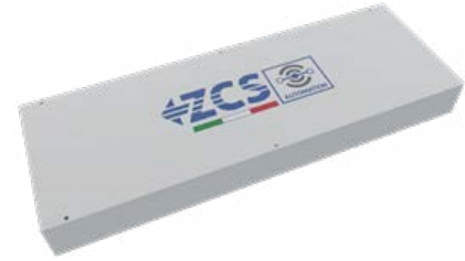
767 Smart box