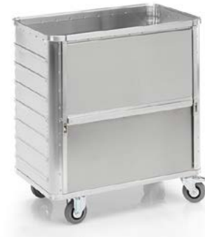
G®-TRANS D 3708