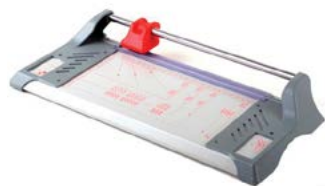
intimus 260 & 320

Dimensiones 260 445 x 200 x 70 mm. Peso: 1,5 Kg. Dimensiones 320 505 x 200 x 70 mm. Peso: 1,7 Kg.