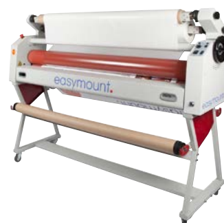
Easymount Sign Cold & Hot

Dim. EMS- 1400C / H: 1846 x 550 x 1365 mm. Peso 136Kg. Dim. EMS- 1600 C / H: 2046 x 550 x 1365 mm. Peso: 156Kg.