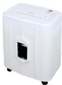
intimus AutoShred 140 CP4