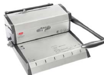
intimus WW-200 DUO