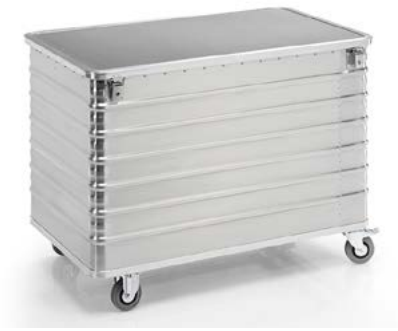
G-DOCU® D 3009