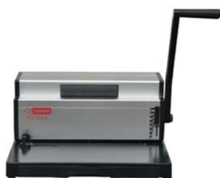
intimus PC-250 A