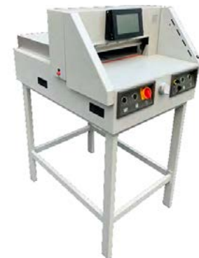
intimus 4908 EP