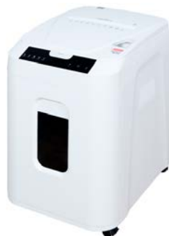
intimus AutoShred 180 CP4