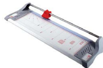
intimus 460 & 670

Dimensiones 460 645 x 200 x 70 mm. Peso: 2,2 Kg. Dimensiones 670 855 x 200 x 70 mm. Peso: 2,7 Kg.