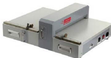
intimus CR-460 ECP