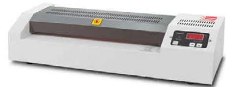
intimus PL-320 & 450 Professional