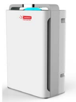
intimus PURE Q65 PRO