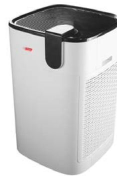
intimus PURE Q110 PRO