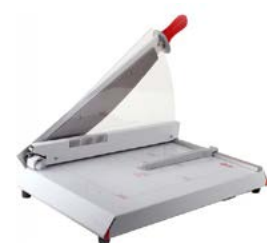
intimus 560 S

Dimensiones 495 x 835 x 525 mm Peso 15 Kg