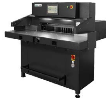
intimus 8080 EPSH

Dimensiones 1645 x 1900 x 1500 mm Peso Aprox. 900 kg