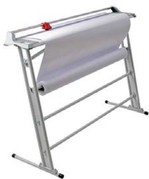
intimus 960 & 1260

Dimensiones 960 1145 x 200 x 70 mm. Peso: 5,3 Kg. Dimensiones 1260 1445 x 200 x 70 mm. Peso: 6,8 Kg.