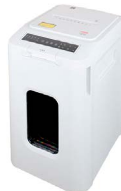
intimus AutoShred 400 CP4