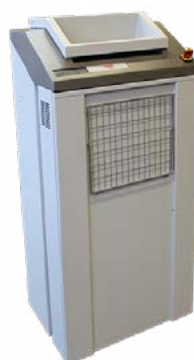
intimus 200 CP5