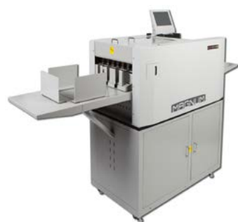
Magnum MCC-35 AS