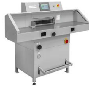
intimus 5280 EPSH POWERCUT

Dimensiones 863 x 1352 x 1250 mm Peso 460 Kg