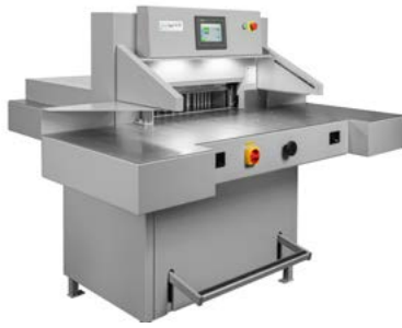
intimus 7310 EPS POWERCUT

Dimensiones 863 x 1352 x 1250 mm Peso 460 Kg