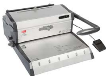
intimus WW-200E DUO