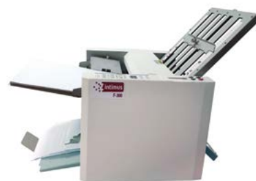
intimus F-300 (A3)