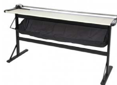
Trimfast 1500 / 2000