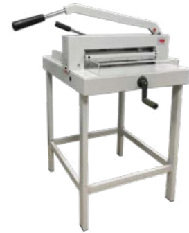
intimus 4340 M