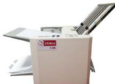
intimus F-200 (A4)