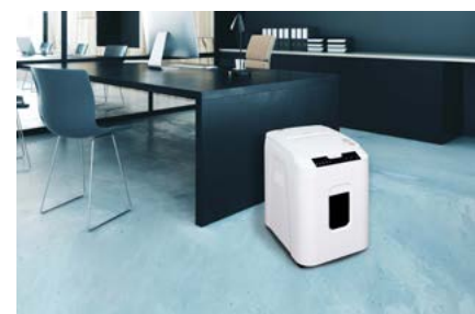
3. Y te vas. ¡hecho!