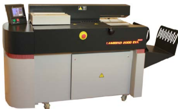
LAMIBIND 2000 EVA