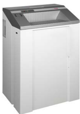
intimus 007 SF