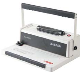
intimus PC-200 A