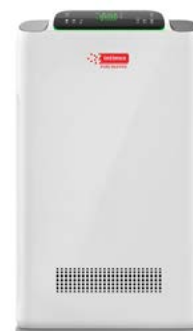
intimus PURE Q45 PRO