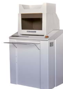
intimus H200 CP4 Auto Oil