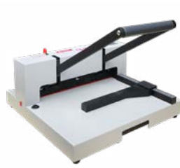
intimus 3115 M