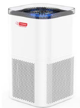
intimus PURE Q30 PRO