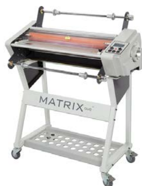
Matrix Duo MD-460 & 650

Dimensiones Matrix DH-460 720 x 480 x 400 mm. Peso: 45Kg. Dimensiones Matrix DH-650 960 x 420 x 400 mm. Peso: 55Kg.