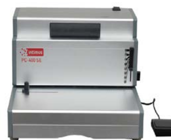
intimus PC-400 SE