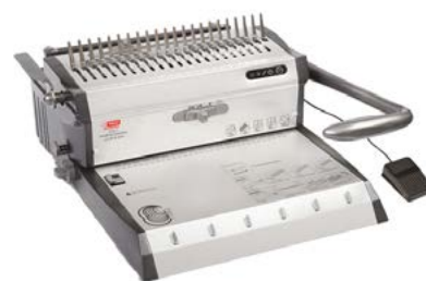
intimus CW-200E DUO